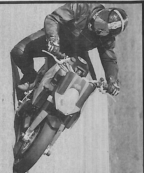
Peu à peu les participants ont « pris de l'angle » et de l'assurance.