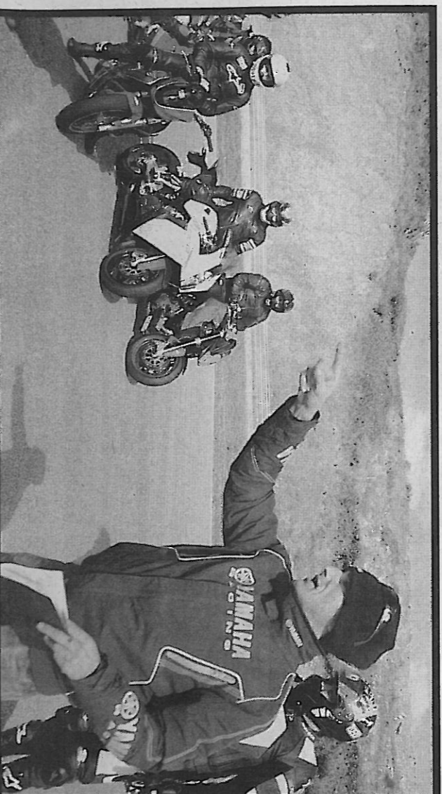
Des conseils précieux suivis au doigt et à l'œil.