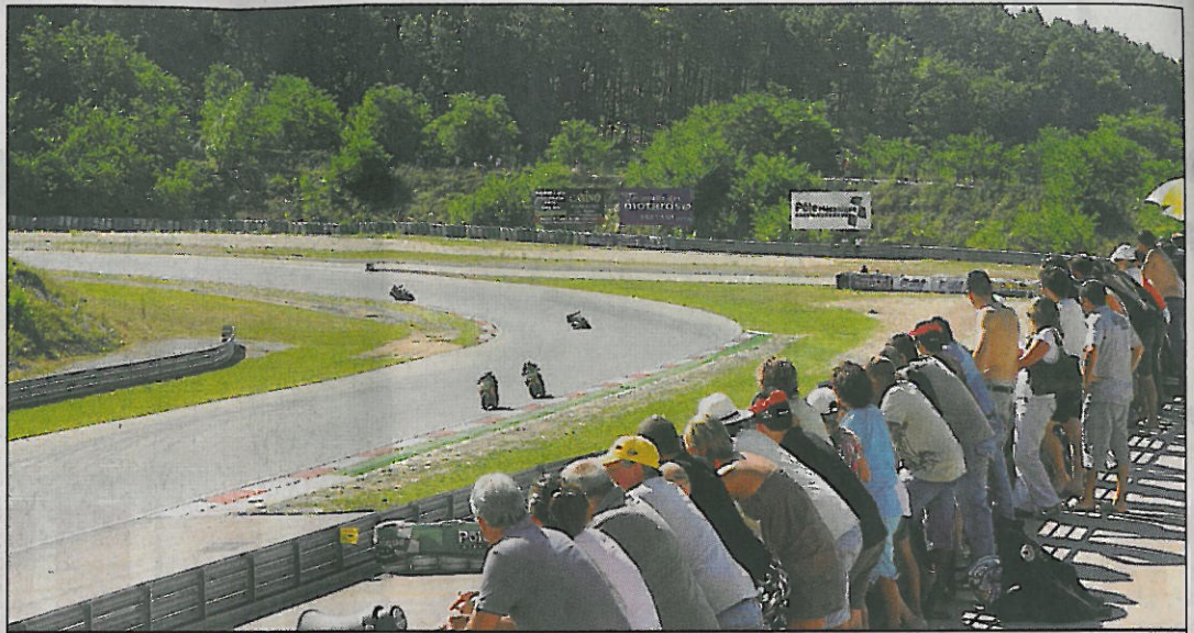
Un millier de personnes sur place, et un nombreux public attendu aujourd'hui pour les finales.

La coupe Promosport, c'est l'occasion de découvrir une compétition organisée sous l'égide de la Fédération française motocyclisme (FFM), avec des conditions de sécurité optimales, un manufacturier comme Dunlop..., de géné-