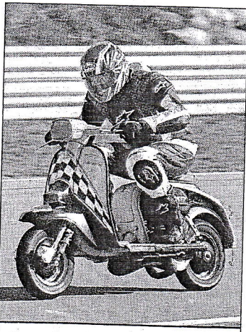
A scooter, ça tourne aussi !

Contacts au 04 66 30 31 85 (auto-moto), 06 26 76 35 15 (moto).